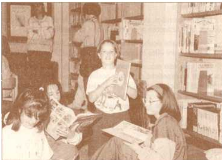
Visita escolar del Colegio Público Los Sauces. Barañain, junio de 1997.