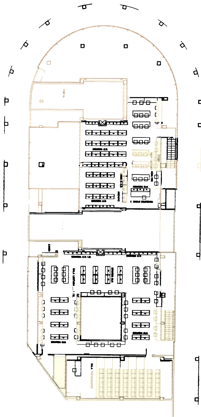
Biblioteca Pública de Burlada. Entrepłanta