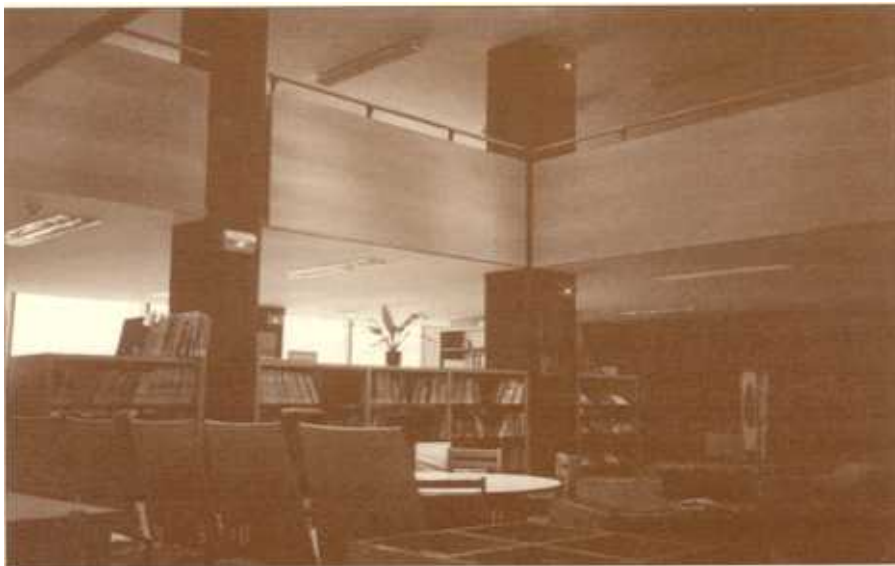
Vista parcial del área infantil y entreplanta