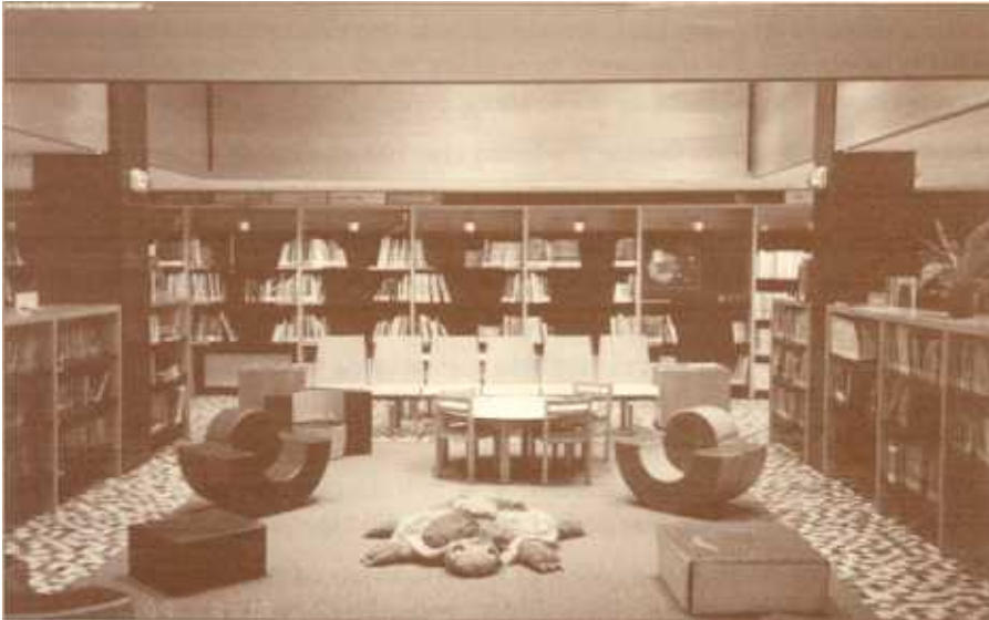
Vista parcial del área infantil

En la sala de lectura de adultos (sala 1) se pudieron distribuir cómodamente 120 puestos de lectura, en planta baja. En la plataforma elevada sobre esta sala (plataforma 1) se permitió la localización de 17 puestos para la consulta de los volúmenes.