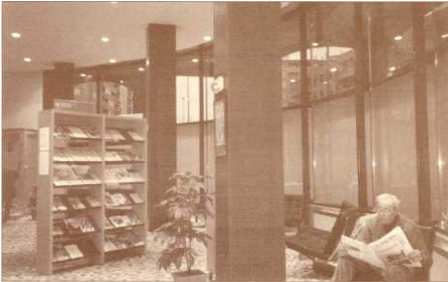
Zona de lectura de publicaciones periódicas

impidiéndose desde la acera el dominio visual sobre el espacio interior. En horario nocturno, la Biblioteca se mostrará como una gran lámpara de luz que invitará a ser visitada, convirtiéndose en un foco cultural para Burlada.