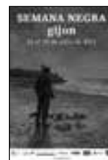
Cartel de la Semana Negra de Gijón 2011

El festival literario es el eje central de la Semana (139 narradores y creadores de cómic a los que se sumaron otros 22 escritores), pero va acompañado de encuentros con autores, recitales de poesía, exposiciones, feria del libro, programación musical y muchas otras actividades que se detallan en el programa.