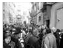
Aspecto del exterior de la librería y el Carrer de la Sal el día de clausura

El programa incluía muchas más cosas de las que no pude disfrutar: ciclos de cine, teatro, exposiciones, intercambio de libros, actividades para el público infantil, encuentros de los clubes de lectura de novela negra juvenil, talleres de escritura, actividades en bibliotecas e, inclu-