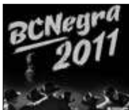
Cartel de BC Negra 2011

librero es “el comisario” en el amplio sentido de la palabra. Pero son muchos los participantes, colaboradores y patrocinadores. Al menos 26 editoriales han colaborado en el programa de este año. Incluso, la BCNegra ha implicado a un grupo de seis restaurantes y nueve coctelerías que, mientras dure el festival, ofrecerán menús y cócteles inspirados en las tramas y personajes de los libros.